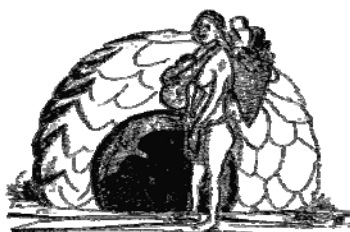
Maison de l'Enfant et de la Femme Pygmées